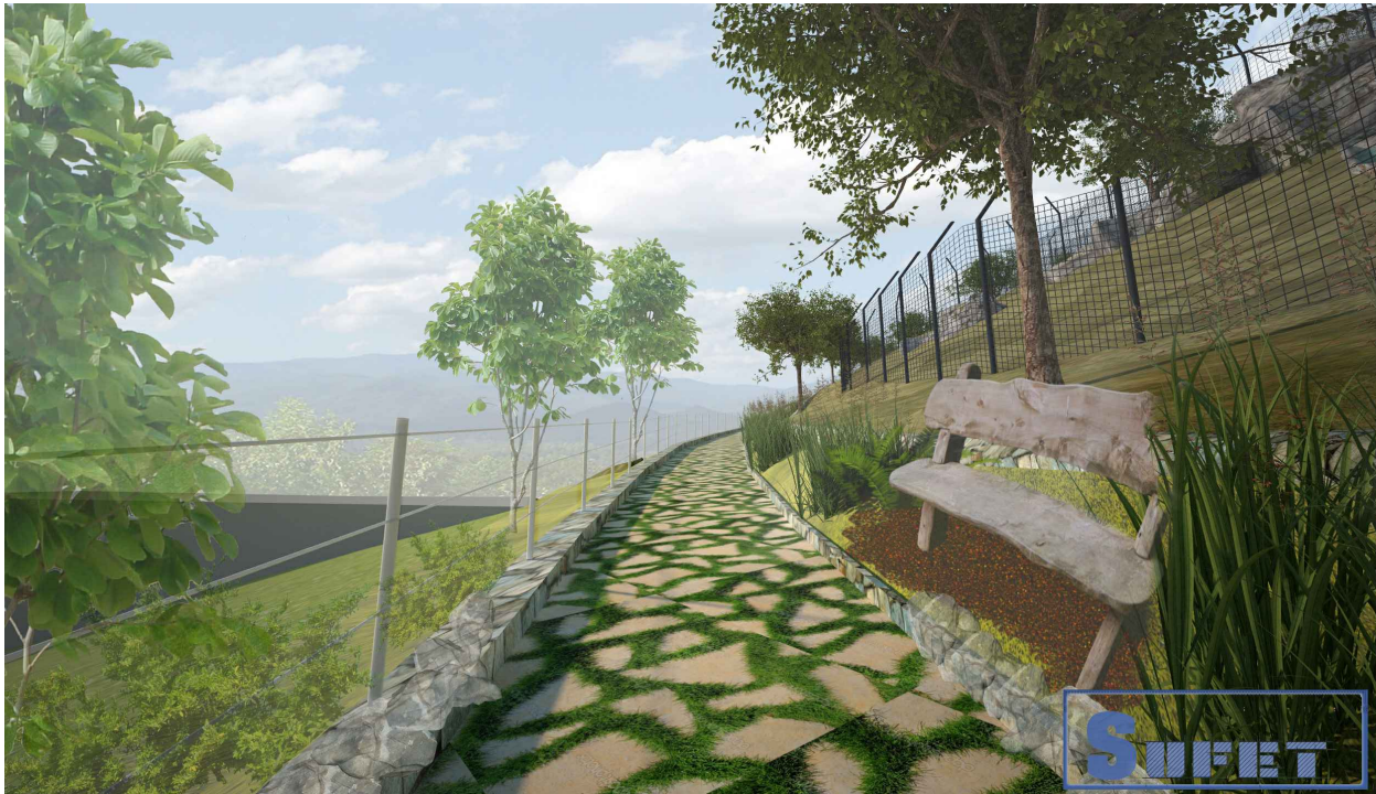
Տեսք ճանապարհ 2