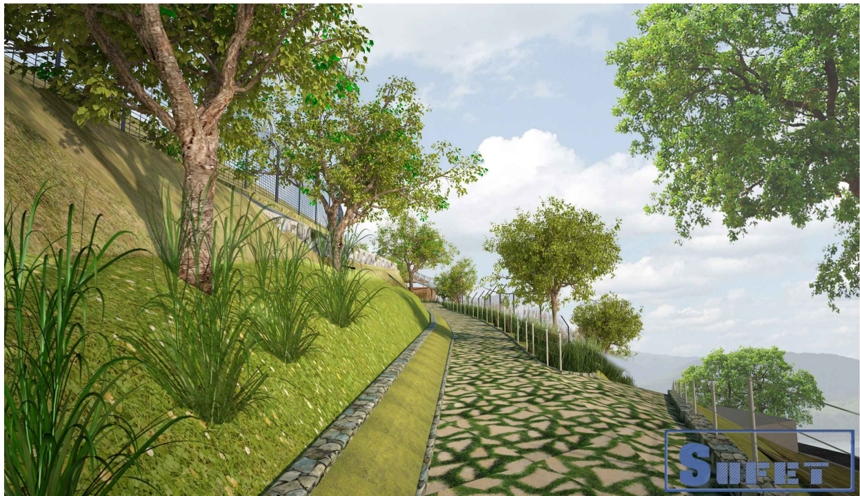
Տեսք ճանապարհ 3