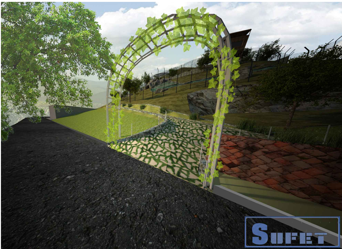
Տեսք մուտքի մետաղական կամար